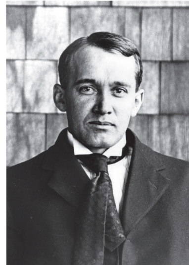
Figure 2. Vesto Melvin Slipher 1905