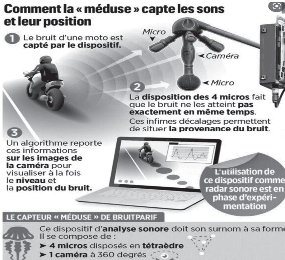
Figure 2. Fonctionnement du dispositif « méduse ». https://www.leparisien.fr/