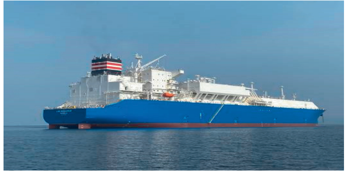
Le méthanier français LNG Endeavour

Le transport de gaz liquéfié par méthanier présente des défis technologiques. En effet, en dépit de l'excellente isolation thermique des réservoirs des méthaniers transportant le Gaz Naturel Liquéfié (GNL) à température cryogénique, les transferts thermiques entre les cuves et leur environnement engendrent une évaporation du GNL. Ce gaz d'évaporation doit être relâché afin d'éviter l'apparition de surpressions qui pourraient endommager la structure du méthanier.