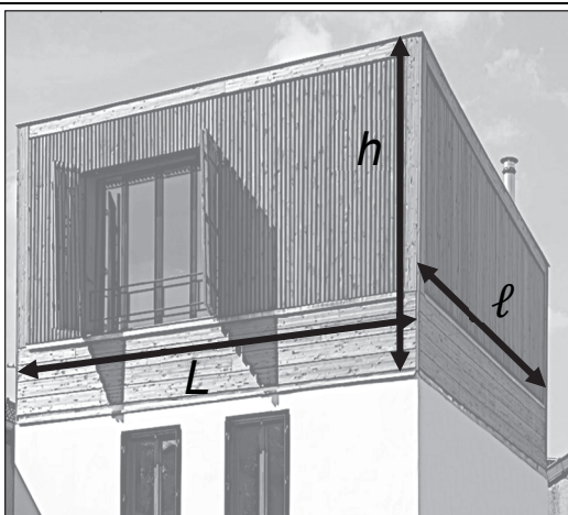
Figure 1. Croquis de l'extension à construire