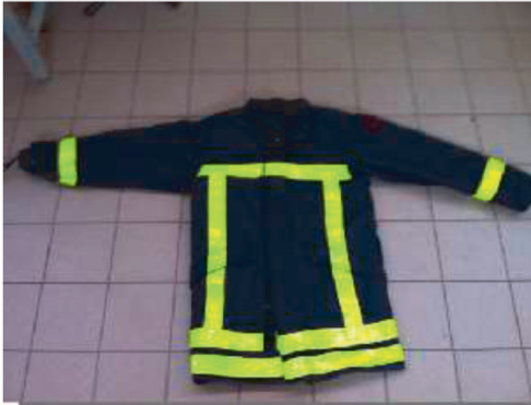
Figure 1. Veste de pompier