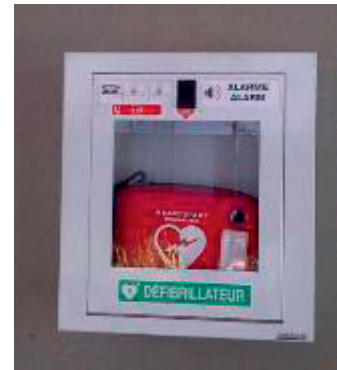
Un défibrillateur installé en lycée

L'objectif de cet exercice est de comprendre le fonctionnement d'un défibrillateur au travers d'un modèle simplifié.