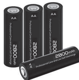
Photographie de piles AA de capacité 2800 mAh

Chaque année en France, 1,3 milliard de piles sont vendues dans le commerce. Petits réservoirs d'énergie, elles constituent des objets indispensables au quotidien. L'objectif de cet exercice est d'étudier le fonctionnement d'une pile réalisée au laboratoire et de comparer sa capacité électrique à celle d'une pile AA vendue dans le commerce, photographiée ci-contre.