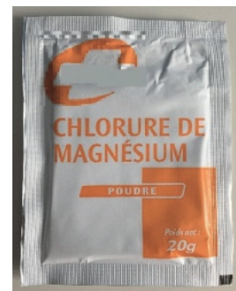
Photographie d'un sachet de chlorure de magnésium en pharmacie

La poudre présente dans le sachet est du chlorure de magnésium hydraté pur, de formule \text{MgCl}_2 \cdot 4,5 \text{ H}_2\text{O} , où 4,5 est appelé le degré d'hydratation. Celui-ci représente le nombre de moles d'eau présentes dans une mole de chlorure de magnésium hydraté.