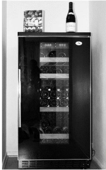
Cave à vin

Mots-clés : premier principe et loi phénoménologique de Newton, intensité sonore, atténuation.