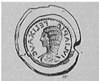
Moule en terre cuite d'une monnaie de Julia Domna

Des moules en céramique permettaient de fabriquer des pièces en y coulant des métaux en fusion notamment du bronze allié à base de cuivre. Ces moules étaient faits en rondelles de terre cuite à grain très fin. Sur les deux faces de chacune de ces rondelles était imprimée en creux l'empreinte d'une médaille.