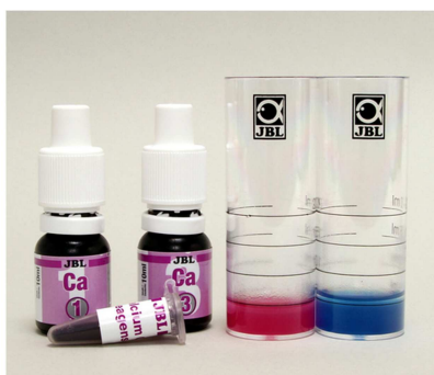
D'après le site www.jbl.de