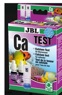
D'après le site

Afin de déterminer rapidement la concentration en calcium d'une eau de mer, un test colorimétrique est proposé dans le commerce. Le technicien d'un élevage de corail effectue régulièrement ce test dans les différents bassins de l'exploitation : il est rapide et moins coûteux qu'une analyse chimique effectuée dans un laboratoire.