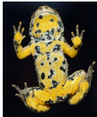
Photo de la face ventrale

Le crapaud sonneur à ventre jaune, Bombina variegata , est une espèce d'Amphibien qui fait partie des espèces vulnérables et menacées. Elle fait l'objet d'une protection en France.