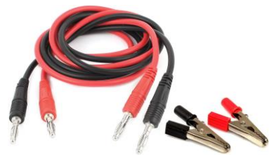
Câbles et pinces