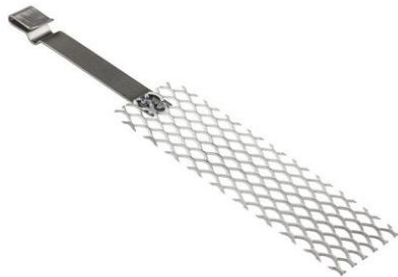
Électrode de titane platiné