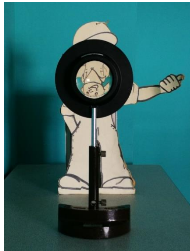
Photographie 2 : première expérience réalisée au laboratoire

Le groupe d'élèves a ainsi reproduit au laboratoire la situation de la station spatiale en remplaçant la bulle d'eau par une lentille mince convergente (L) de grand diamètre (10,0 cm) et de distance focale f' dont la valeur sera assimilée à celle de la question 7 soit f' = 0,126 m. L'astronaute est remplacé par un personnage en bois de hauteur 44,0 cm dont le visage mesure 8,5 cm de haut. Un premier essai figure sur la photographie 2. Lors de la prise de vue, la distance entre la lentille (L) et le personnage est de 33,0 cm.